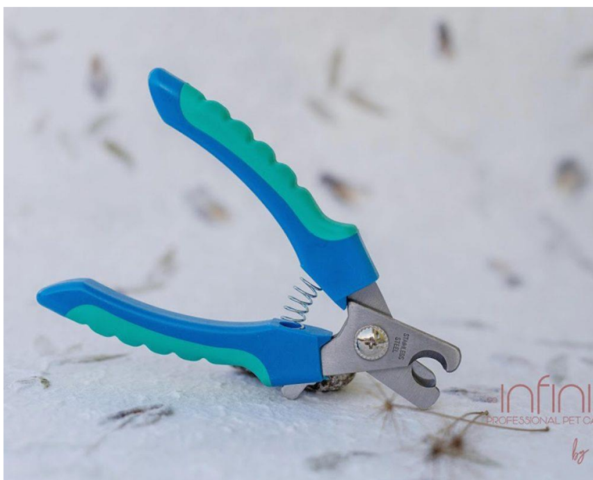
Klešče za kremplje

V kolikor pri krajšanju krempljev nismo samozavestni oz. se le-tega bojimo, je bolje, da kremplje namesto nas skrajša veterinar ali pasji frizer.