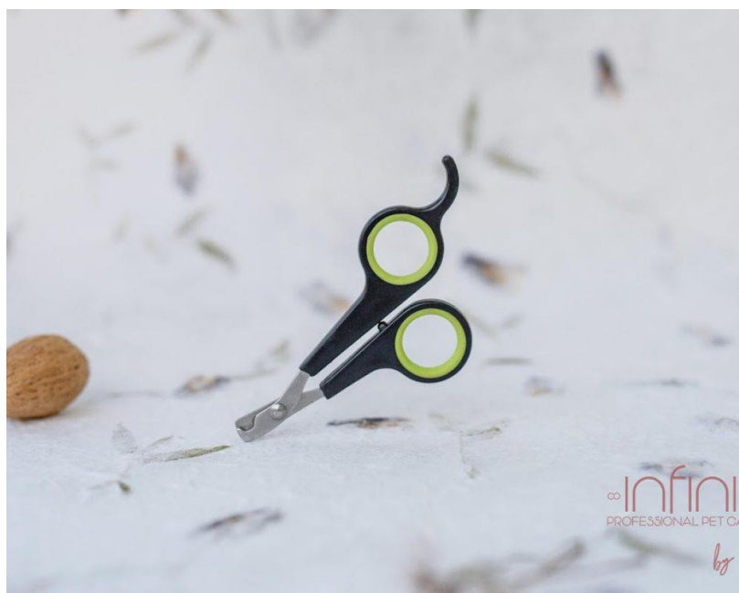
Škarje za kremplje