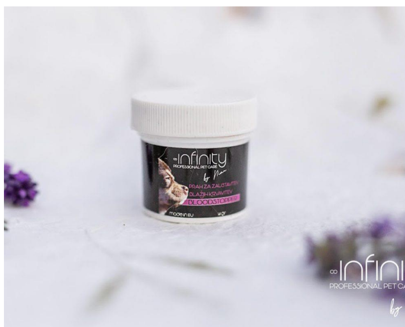
Prah za zaustavitev krvavitev Infinity