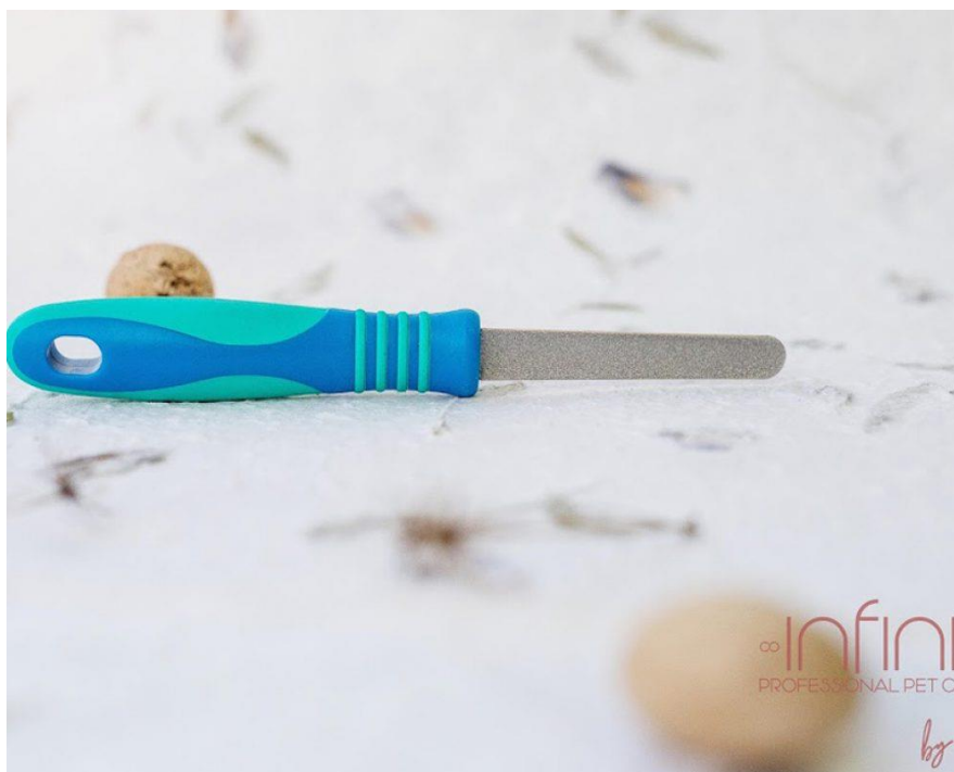
Pila za kremplje Infinity